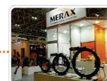
Rio Oil & Gás 2012