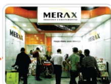
Feira da Mecânica 2014