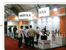
Brasil Offshore 2011