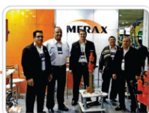
Concrete Show 2014