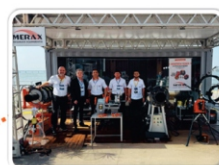
Rio Oil & Gás 2024