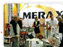
Concrete Show 2014