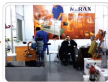
Feira da Mecânica 2010