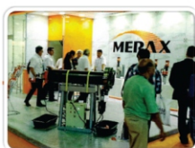
Rio Oil & Gás 2014