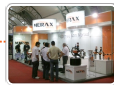
Brasil Offshore 2011