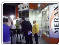
Rio Oil & Gás 2008