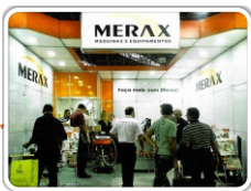
Feira da Mecânica 2014