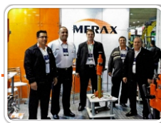
Concrete Show 2014