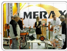
Concrete Show 2014