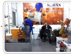
Feira da Mecânica 2010