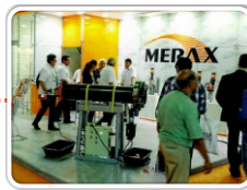
Rio Oil & Gás 2014