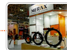
Rio Oil & Gás 2012