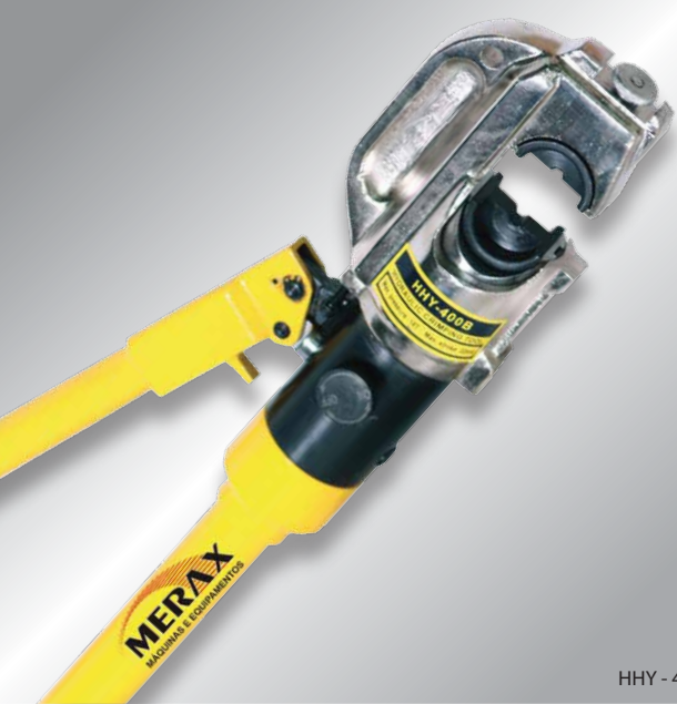
HHY - 400B