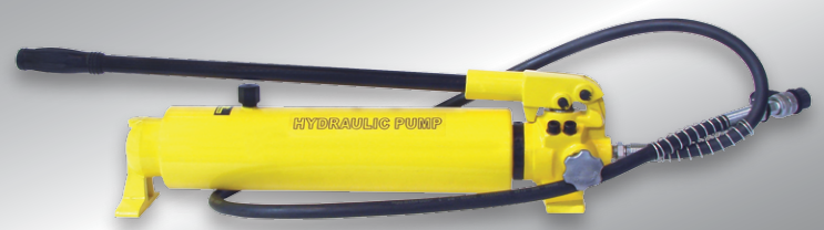
CP - 700A