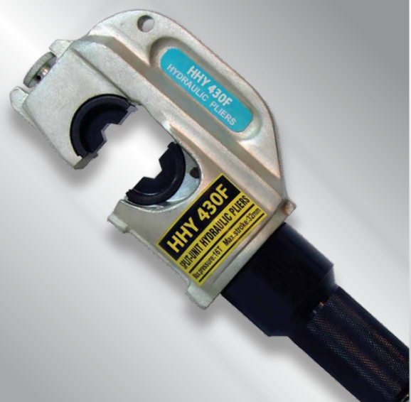
HHY - 430F